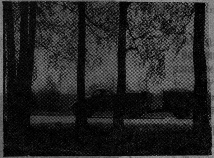
ДОРОГА ВДОЛЬ ОПУШКИ.