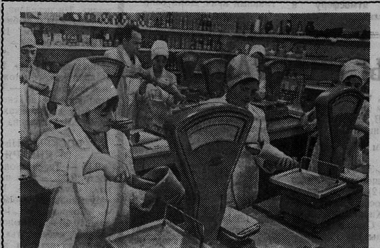
Ежегодно около 300 выпускников Тульского кооперативного профессионально-технического училища приходят на работу в сельские магазины, предприятия общественного питания, пекарни. НА СНИМКЕ: практические занятия в учебном магазине.