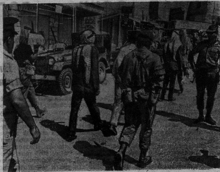
Израильские агрессоры продолжают бесчинствовать на оккупированных ими арабских территориях. На снимке: израильские солдаты ведут под конвоем жителей иорданского города Хеброн.

КОГДА я по телевизору следил за передвижениями двух американских космонавтов по Луне, я не мог не представить себе такую картину.