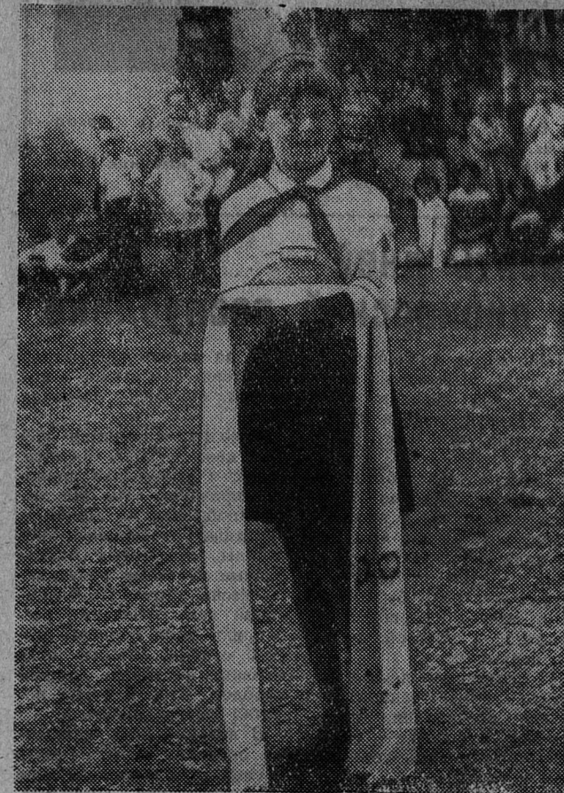
«Живет на всей планете Народ веселый — дети» — под таким девизом проходил пионерский фестиваль. Хлебом с солью на вышитом рушнике встречает русская делегация делегации братских республик и стран.