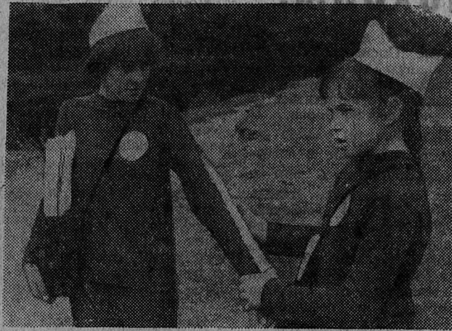
Оказание первой помощи «пострадавшему» — такое задание выполняли все команды, участвовавшие в 18-м районном туристском слете.