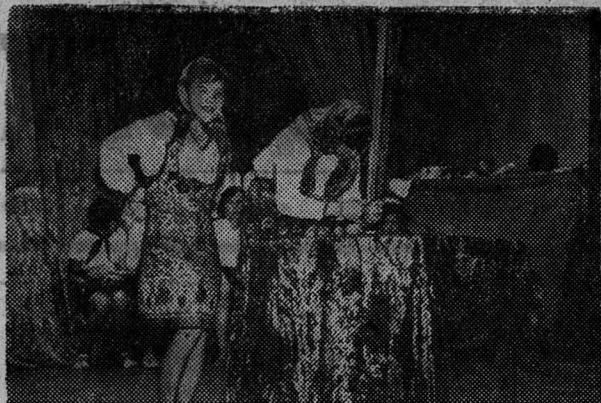
Весело проходит встреча в клубе веселых и находчивых. НА СНИМКЕ: конкурс поварят «Чья команда быстрее почистит картошку».