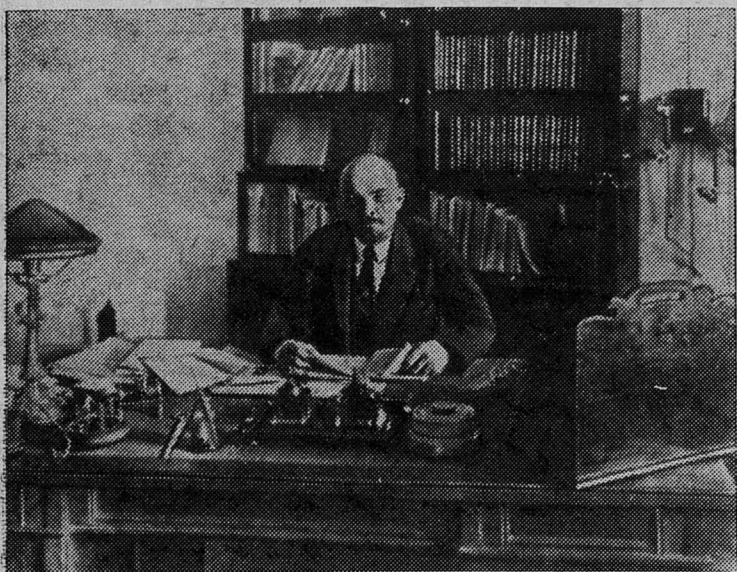
В. И. Ленин во время работы в своем кабинете в Кремле 16 октября 1918 г.