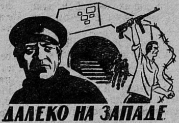
ДАЛЕКО НА ЗАПАДЕ

Действие фильма происходит в 1944 году на одном из французских островов Атлантического океана.