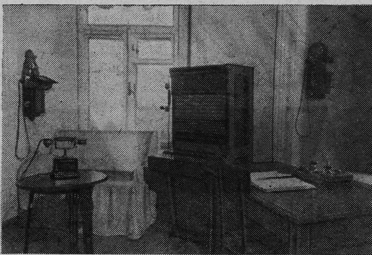
НА СНИМКЕ: кремлевский коммутатор Совнаркома. Он расположен рядом с кабинетом В. И. Ленина. Здесь один из телефонов, по которому Владимир Ильич поддерживал связь с фронтами.

В разгаре осень. В эти дни много забот у работников конторы «Заготзерно». Совхозы спешат обменять зерно нового урожая на комбикорма для скота и на семена для весенней посевной.