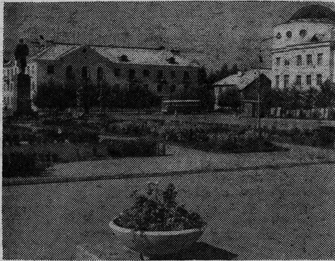
Площадь Ленина у Дворца культуры комбината «Сланцы».

— На нас возложена огромная ответственность. В известной мере это предварительная ответственность, но мы извлекаем уроки из опыта, и я надеюсь, что при разработке планов будущего мира мы установим такое же доброе сотрудничество и единство действий, какого мы достигли в деле ведения войны. Это совершенно замечательный факт, что мы вели эту войну с таким великим единодушием. Я думаю, что тут многое зависело от личностей. В 1941 году в период разработки Атлантической хартии, например, я плохо знал мистера Черчилля. Я встречался с ним один или два раза, совершенно неофициально, в период первой мировой войны. Но в Северной Атлантике, после трех-четырёх дней, проведенных вместе, мы сильно повялились друг