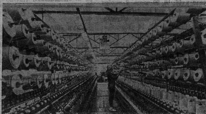
Так выглядит кругильный цех текстильного предприятия в венгерском городе Бай. Государство ассигновало большие денежные средства для модернизации оборудования и рабочих помещений этой фабрики.