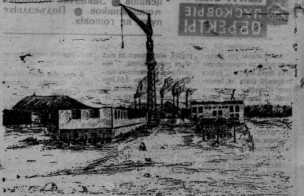
Рисунок Михаила Подобеда, электрослесаря шахты имени С. М. Кирова.