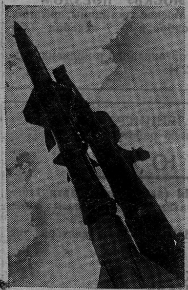
Наши воины владеют новейшей боевой техникой. Зенитная ракета на стартовой позиции.