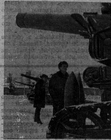
НА СНИМКЕ: самоходные артиллерийские орудия у музея.

ЛЕНИНГРАД. В Военно-историческом музее артиллерии, инженерных войск и войск связи — более двухсот тысяч экспонатов. Шесть веков насчитывает история отечественной артиллерии. В сражениях, снискавших славу русскому оружию, советская артиллерия прошла славный путь, всегда являясь надежным огненным щитом Родины. Об этом и рассказывают экспонаты музея.