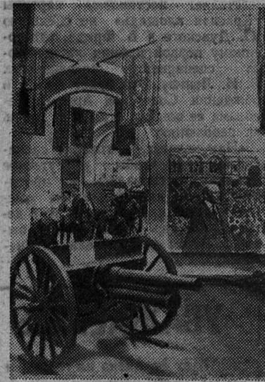
НА СНИМКЕ: в зале «Артиллерия в Великой Октябрьской социалистической революции и гражданской войне».