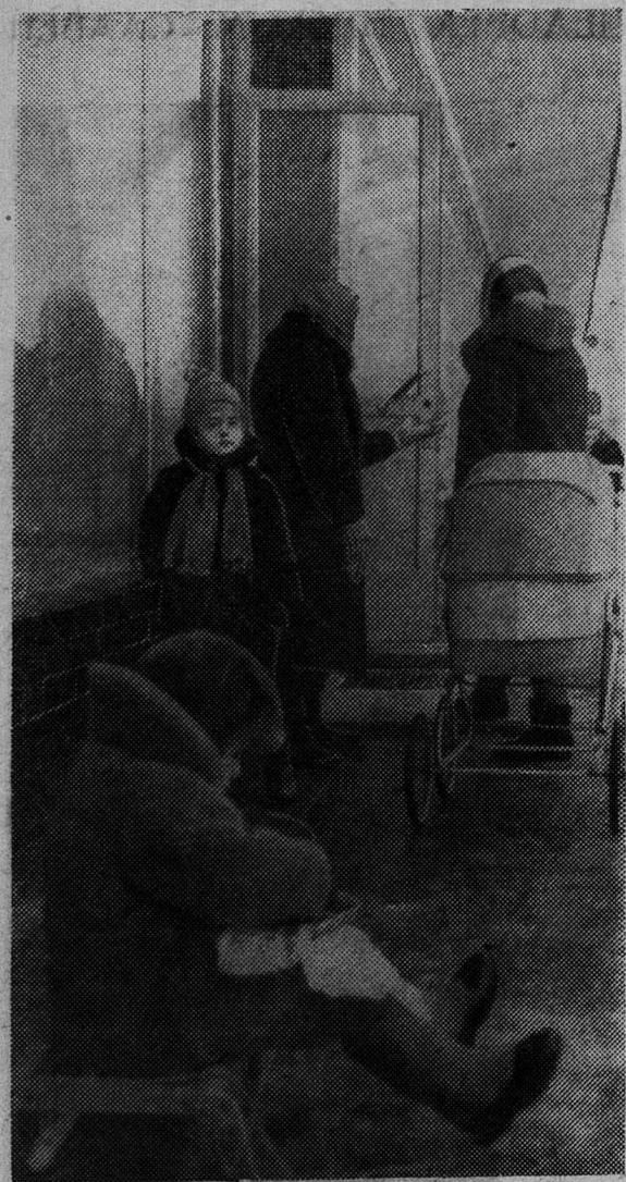
ПОКА МАМА В МАГАЗИНЕ.