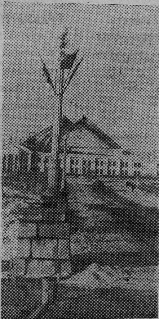
Вид на старейшую шахту города — имени С. М. Кирова — с моста через Плюсса.