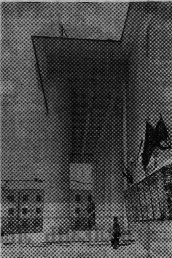
АРХИТЕКТУРНЫЙ АНСАМБЛЬ.

Кинофильм будет демонстрироваться в кинотеатре «Труд» 3 и 4 апреля.