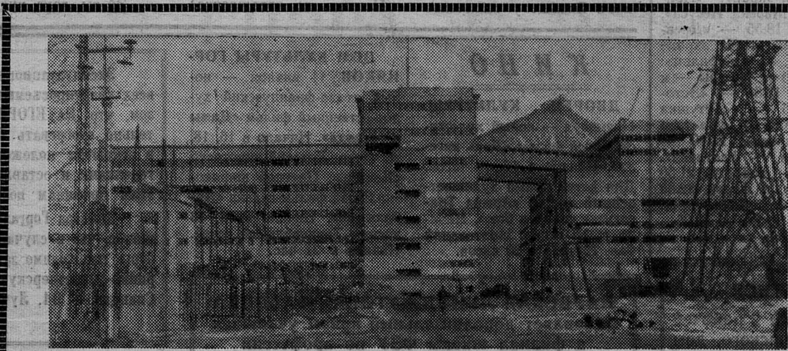
НА СТРОЙКАХ ГОРОДА. ОБОГАТИТЕЛЬНАЯ ФАБРИКА ОБЪЕДИНЕННОЙ ШАХТЫ.