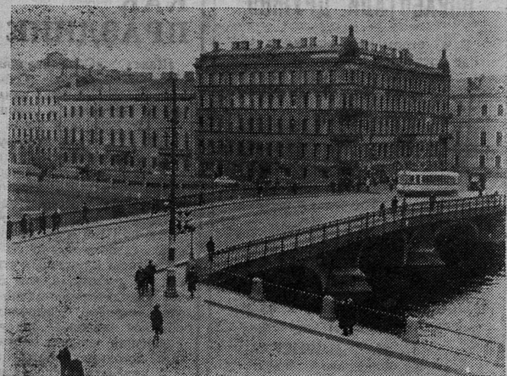
Ленинград. Мост Белинского (Симеоновский мост через реку Фонтанку). Здесь 1 января 1918 года контрреволюционеры-террористы обстреляли автомобиль, в котором ехали В. И. Ленин и швейцарский социалист Ф. Платтен. Владимир Ильич и его сестра остались невредимы, был легко ранен Платтен.