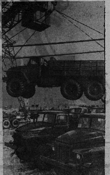
Достойную встречу 100-летия со дня рождения Владимира Ильича Ленина готовит коллектив Уральского автомобильного завода в городе Миассе. План по реализации продукции в первом квартале перевыполнен. Для народного хозяйства отправлено большое количество автомашин высокой проходимости — «Урал-375», «Урал-377», а также автотягачей. НА СНИМКЕ: на погружной площадке.

ВАЖНЕЙШИМ В ВОСПИТАНИИ комсомольцев и молодежи мы считаем формирование у юношей и девушек коммунистического отношения к труду, развитие творческой инициативы, чувства высокой ответственности за дела коллектива и общества. Этого мы достигаем путем постоянного влияния на молодежные коллективы.