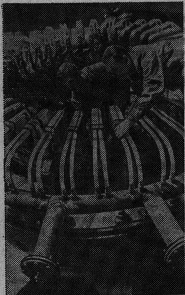
На ленинградском заводе «Электросила» подходят к концу работы по изготовлению турбогенератора-исполни мощностью в один миллион киловатт. Нигде в мире нет такой машины.

И здесь Ильич работал целыми днями, каждую минуту подчинив строгому режиму. Ранний под-