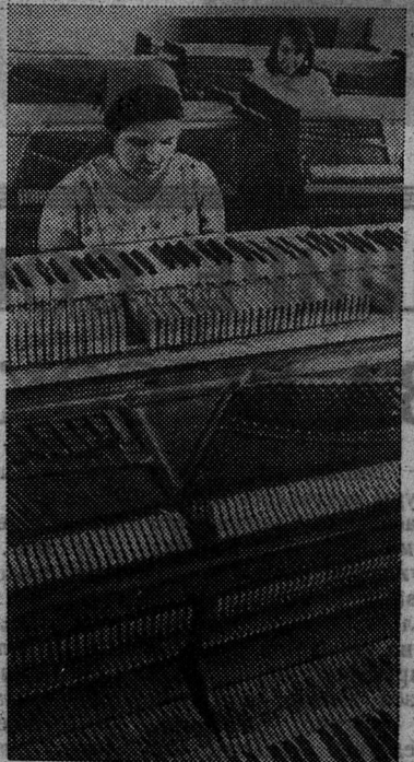
Саратовская фабрика музыкальных инструментов изготовит в этом году около двух с половиной тысяч пианино и три тысячи гармонок.

Наблюдать возвращение исчезнувшей памяти было захватывающе интересно. Уотермен умел об-