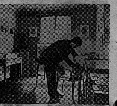
На снимке: Музей-квартира В. И. Ленина в Париже по улице Мари-Роз, дом 4. Здесь Владимир Ильич жил с 1909 по 1912 год.

Поворотным пунктом в жизни партии в те годы, по определению Ленина, явилась V Общероссийская конференция РСДРП, состоявшаяся в Париже в начале января 1909 г. В центре работы конференции был доклад Ленина «О современном моменте и задачах партии», по которому была принята предложенная им резолюция. Конференция решительно осудила ликвидаторство. Против ликвидаторов выступил также Плеханов, что было расценено Лениным как победа большевизма. На основе решений конференции Ленин и его единомышленники развернули решительную борьбу с врагами партии. В ходе этой борьбы большевистская партия укрепляла свои ряды, отстаивала правильность своей революционной политики и тактики.