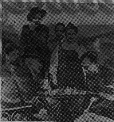
Весной 1908 года Владимир Ильич по приглашению А. М. Горького провел некоторое время на острове Капри (Италия), где жил тогда знаменитый писатель. Ильич

вел задушевные беседы с Алексеем Максимовичем, приглашал его более активно сотрудничать в газете «Пролетарий», рекомендовал написать о своем детстве и юности, о скитаниях по Руси, о чем рассказывал Горький в беседах с Лениным. Впоследствии писатель выполнил пожелания Ильича и создал книги «Детство», «В людях», «Мои университеты». В конце 1908 года Ленин переезжает в Париж, куда было перенесено издание «Пролетария». Сделано это было потому, что Париж стал в то время центром русской эмиграции. Кроме того, условия жизни в Женеве изменились из-за преследования швейцарскими властями русских революционеров.