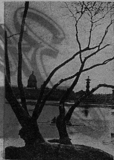
ЛЕНИНГРАД. Весенний этюд.