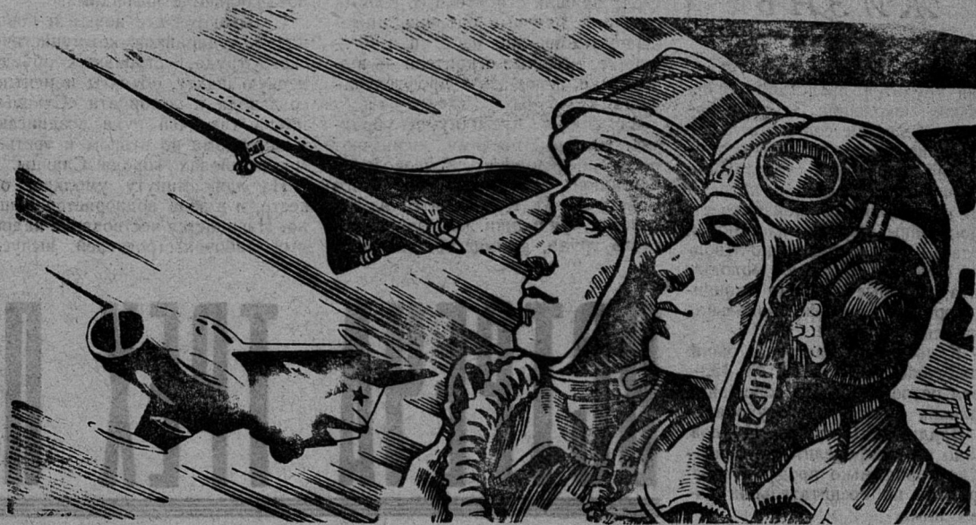
Рисунок художника С. Гринько.

неограниченных погодных условий, околозвуковых и сверхзвуковых скоростей, предельно малых и стратосферных высот, больших полезных нагрузок и дальностей полета. Новая современная техника и ракетно-ядерное оружие высокой точности неизмеримо увеличили боевую мощь ВВС. Советская ордена Ленина гражданская авиация — многогранное и сложное хозяйство, оснащенное новейшими лайнерами и вертолетами, — вносит ощутимый вклад в выполнение народнохозяйственных планов. Наш Аэрофлот является самым крупным воздушно-транспортным предприятием планеты. Крепко держат в руках «ключи от неба» советские авиаторы, в совершенстве владеющие сложной техникой. Воздушный Флот находится на должном уровне и способен вместе с другими видами Советских Вооруженных Сил выполнять самые сложные задачи защиты Родины.