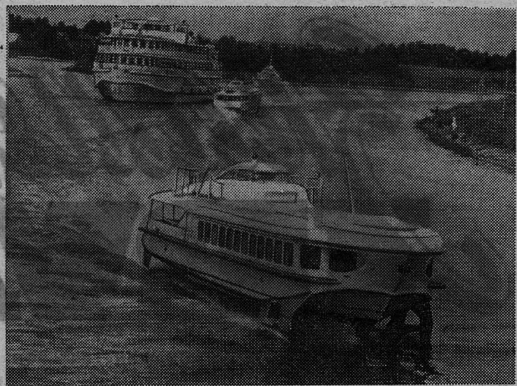
МОСКВА. Тысячи москвичей проводят свой отдых, совершая увлекательное путешествие по каналу имени Москвы.

Н. КУХАРЕВ, секретарь парткома совхоза «Родина».