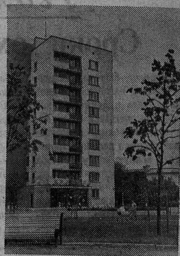
В этом году в Красном Селе будет сдано в эксплуатацию 48.000 квадратных метров жилой площади.

На снимке: новый девятиэтажный жилой дом в центре Красного Села, на проспекте Ленина.