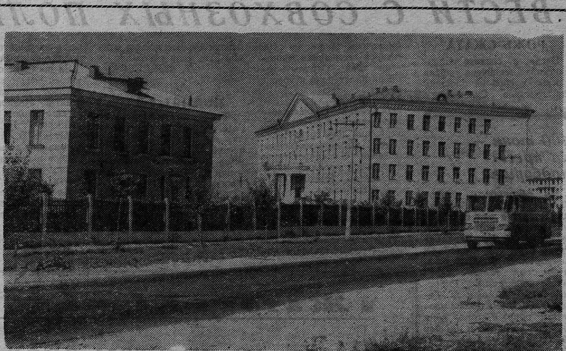
НА СНИМКЕ: общий вид центральной районной больницы.