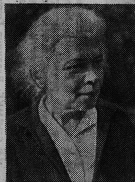
Мария Ильинична Ульянова

— Мне скоро умирать, — говорил он, — но перед смертью хотелось бы видеть Владимира Ильича Ленина. Только бы увидеть его, родного, а потом можно и умереть.