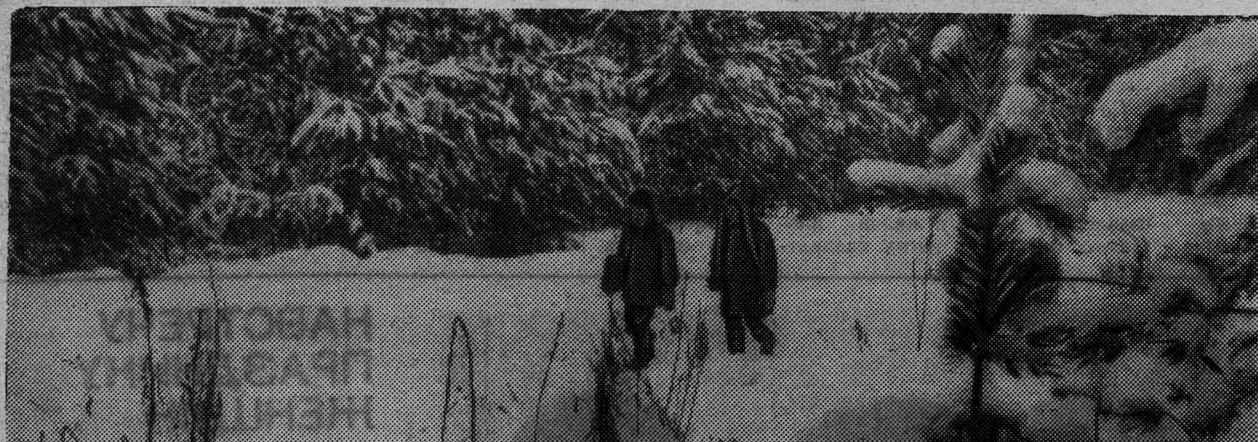
Лесной дорогой в сельскую школу.