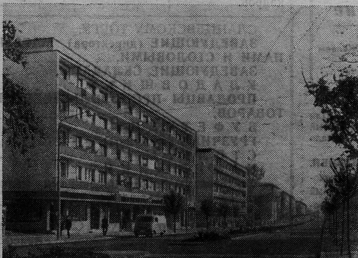
Бульвар имени Георгия Димитрова в породе Стара-Загора.

Народная Республика Болгария по числу студентов на