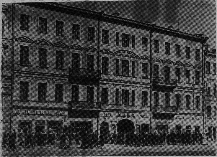
ЛЕНИНГРАД. Невский проспект, 108. В начале 1906 года В. И. Ленин встречался здесь с сотрудниками большевистских газет и другими партийными работниками.