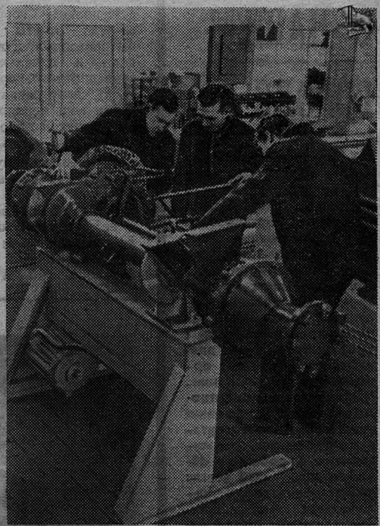
В машиноремонтной мастерской павильона «Метанизация и электрификация сельского хозяйства» ВДНХ СССР, где представлены различные виды ремонтного оборудования, недавно появился новый комплект приспособлений для восстановления узлов комбайнов поточным методом, разработанный и изготовленный рядом институтов и заводов страны.

НА СНИМКЕ: стенд из этого комплекта, предназначенный для ремонта мостов ведущих колес зерновых комбайнов «СК-3» и «СК-4». Представлен Сибирским филиалом института «ГОСНИТИ».