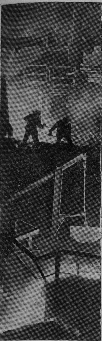
Доменщики Западно-Сибирского металлургического завода с начала этого года выдали стране около 17 тысяч тонн чугуна дополнительно к заданию. НА СНИМКЕ: выпуск чугуна на первой домне Засиба.