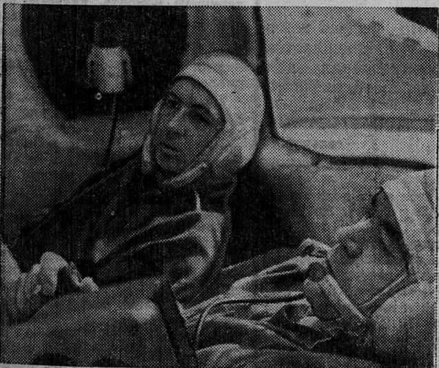
Командир космического корабля «Союз-9» А. Г. Николаев (на переднем плане) и бортинженер В. И. Севастьянов на тренировках.