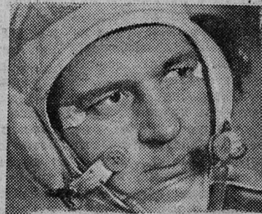
Бортинженер космического корабля «Союз-9», кандидат технических наук Виталий Иванович Севастьянов.

Полет космического корабля «Союз-9» продолжается.