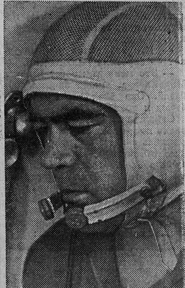
Командир космического корабля «Союз-9» Андриян Григорьевич Николаев.