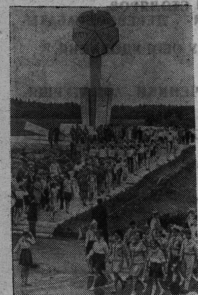
В Ленинграде проходил IV Всесоюзный слет пионеров. У мемориала «Цветок жизни» состоялся митинг солидарности.