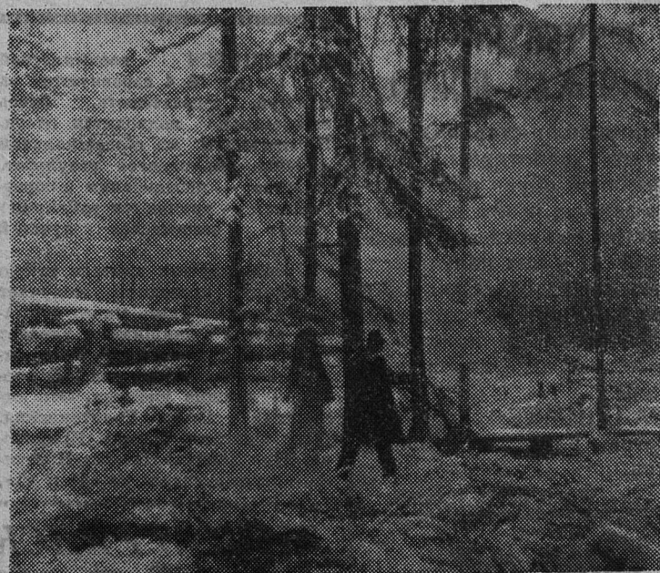
КРАЙ НАШ СЛАНЦЕВСКИЙ. На лесной делянке.