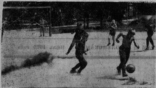
Хозяином положения чувствует себя этот футболист. Он уверенно ведет мяч к воротам «противника»...