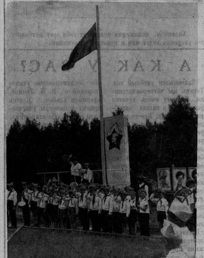
Жизнь в пионерском лагере начинается с торжественной линейки.