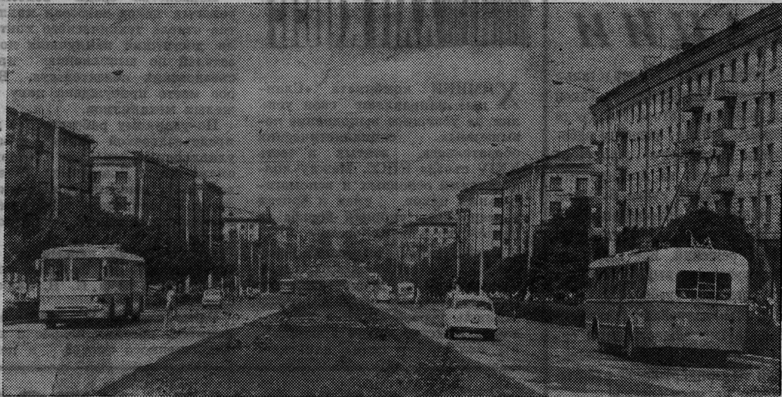
Проспект Ленина в Запорожье.