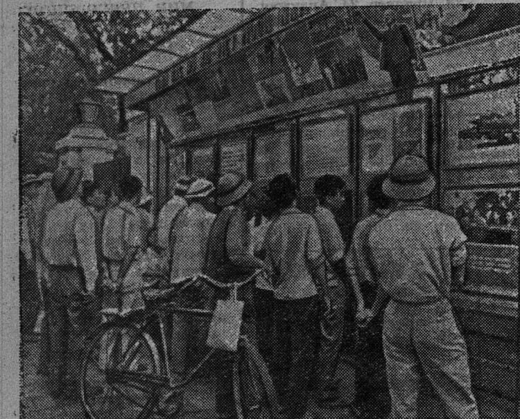
Демократическая Республика Вьетнам. Жители Ханоя знакомятся с фотопанорамой, посвященной братской дружбе советского и вьетнамского народов.