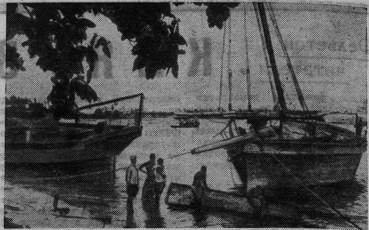
Танзания. Одна из многочисленных бухт Дар-эс-Салам. Отсюда ловцы жемчуга отправляются на промысел.