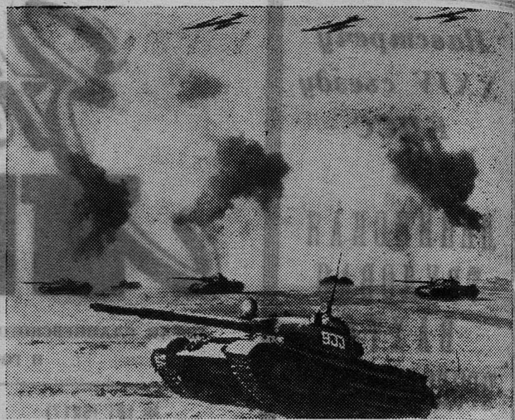
Будни Советской Армии. Воины армии совершенствуют боевое мастерство. НА СНИМКЕ: учебная атака подразделения танкистов.

ствия как днем, так и ночью, форсировать реки по дну, во взаимодействии с другими родами войск успешно преодолевать оборонительные рубежи и развивать наступление в невиданных масштабах. Такими они стали благодаря неустанной заботе Коммунистической партии, правительства и всего советского народа об укреплении обороноспособности Родины. Отвечая на эту заботу, воины-танкисты успешно овладевают новой техникой, новыми формами боя, настойчиво совершенствуют свою боевую и политическую подготовку. Они, как и все воины Вооруженных Сил СССР, ограждают мир и спокойствие советского народа, служат надежной опорой для сохранения мира во всем мире.