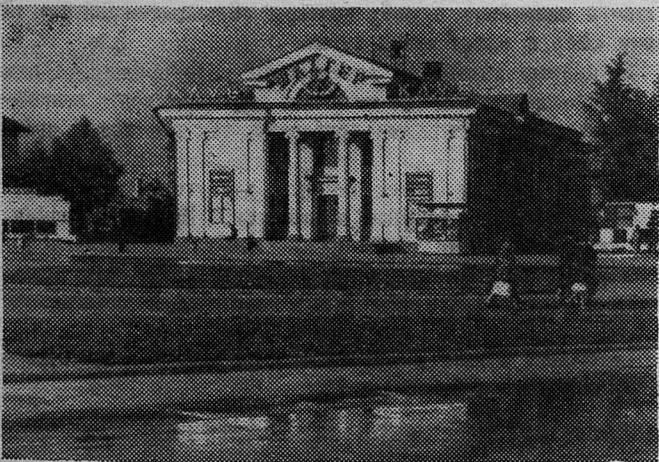
НА СНИМКЕ: клуб «Шахтер».

На 300 г муки: 80 г сахара, 2 яйца, соль по вкусу. Для начинки — на 5 яблок: 100 г сахара, 50 г сахарной пудры, 20 — 30 г воды.