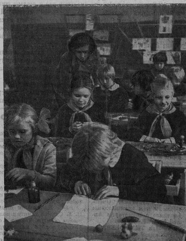
Юннатский кружок при Доме пионеров делает свои первые шаги. Ребята занимаются составлением осенних букетов, композиций из лесного материала, учатся писать рассказы о природе.