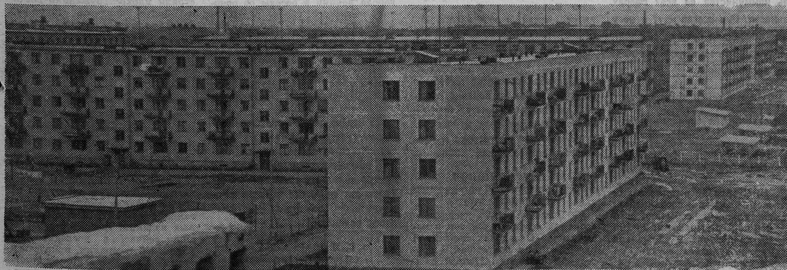
Эти новые дома возведены в третьем микрорайоне нашего города. Из года в год он растет и хорошеет.

По обсужденным вопросам приняты решения.