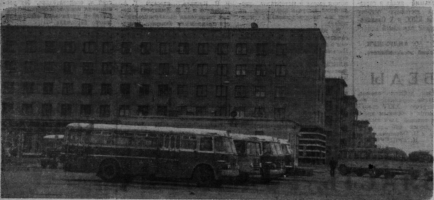
Здесь шоферы автобусов начинают свой рабочий день.

К сведению автора письма. Устранение поврежденных производят монтеры цеха связи по заявкам населения. А ремонт репродукторов — сами абоненты.