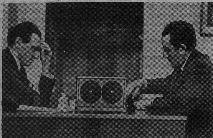
Петросян в третий раз завоевал звание чемпиона СССР по шахматам.

НА СНИМКЕ: Лев Полугаевский («Локомотив» — слева) и Тигран Петросян («Спартак») во время первой партии.