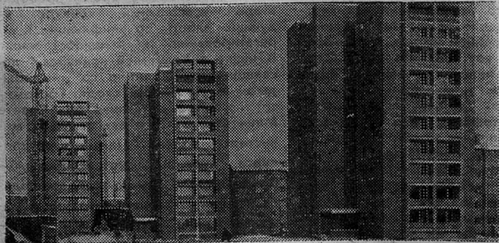
На снимках: Кохтла-Ярве сегодня. Новые девятиэтажные дома в Соцгороде. Завод азотных удобрений, в недалеком прошлом Всесоюзная ударная стройка.

В порядке дня: обсуждение произведений членов литобъединения, оргвопросы.