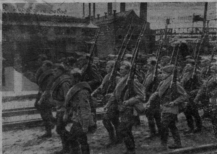
Миллионы советских людей становились в ряды защитников Родины и отправлялись на фронт. 1941 год.