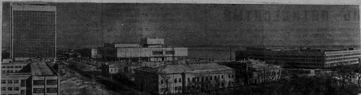
УЛЬЯНОВСК. Близится к завершению строительство Ленинской мемориальной зоны. Ударно трудится коллектив строителей, возводящий объекты величественного памятника вождю пролетариата.