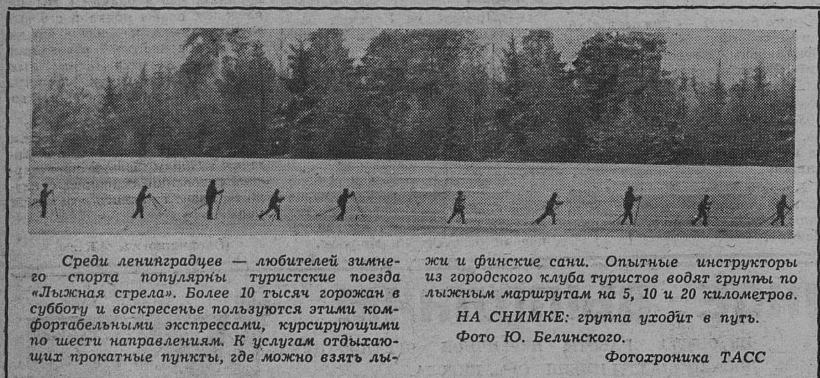
Среди ленинградцев — любителей зимнего спорта популярны туристские поезда «Лыжная стрела». Более 10 тысяч горожан в субботу и воскресенье пользуются этими комфортабельными экспрессами, курсирующими по шести направлениям. К услугам отдыхающих прокатные пункты, где можно взять лы-

Да здравствует почетный Красный командир мировой революции!» Тысячи и тысячи командиров подготовило это старейшее военное училище Советской страны. Воспитанники училища героически сражались на фронтах Великой Отечественной войны, они во всем следуют ленинским заветам. Все эти документы сохраняют вечную теплоту людских сердец, согретых великой любовью к В. И. Ленину, вождю Великой Октябрьской социалистической революции. Д. БЕНДЕРИН, лектор Центрального музея В. И. Ленина.