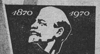
ВСЕРОССИЙСКАЯ СПАРТАКАДА ПО ВОЕННО-ТЕХНИЧЕСКИМ ВИДАМ СПОРТА