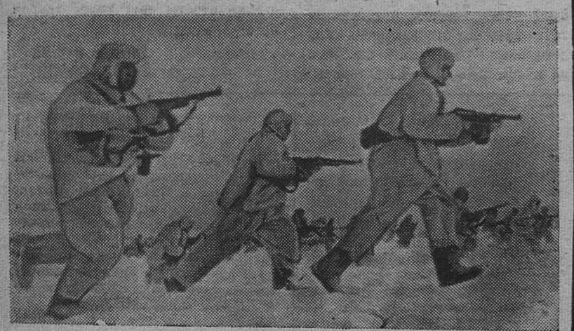
Контратака. Бои зимой 1941 года под Москвой.