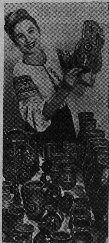
Унгенские гончары издавна славят самыми искусными в Молдавии. Их изделия — молочные кувшины, миски, кружки, вазоны, изготовленные из местной глины и покрытые художественной росписью, — стали неотъемлемой принадлежностью каждого дома.

В. ЗУБАРЕВ, специальный корреспондент «Ленинградской правды». «Ленинградская правда» за 1 марта 1970 года.