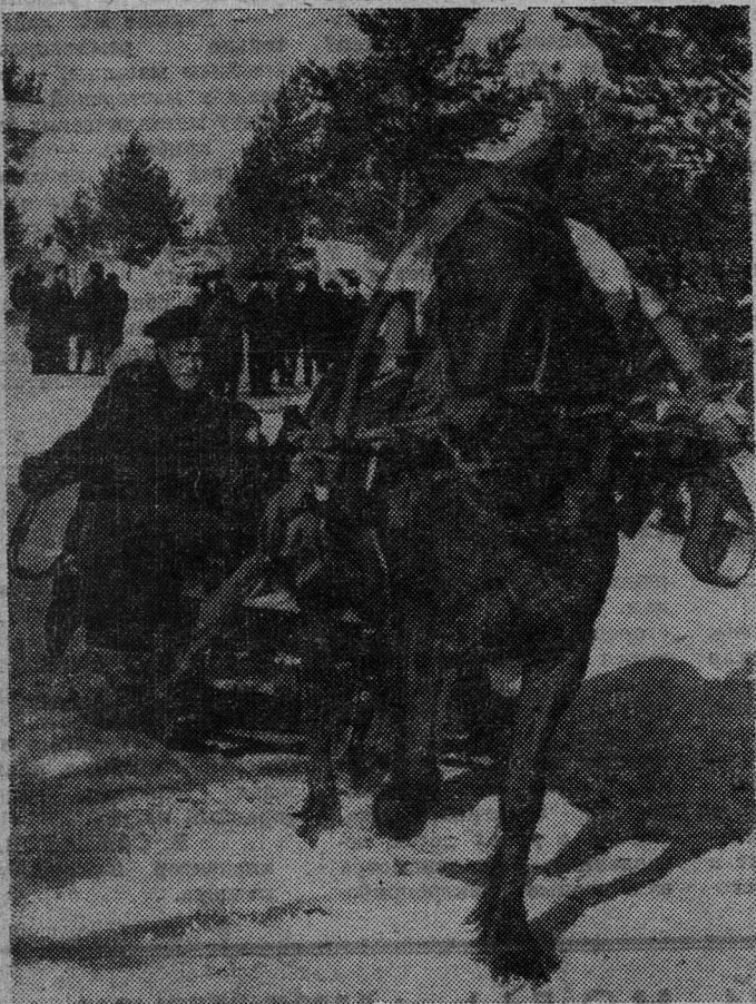
С бубенцами, по русскому обычаю.