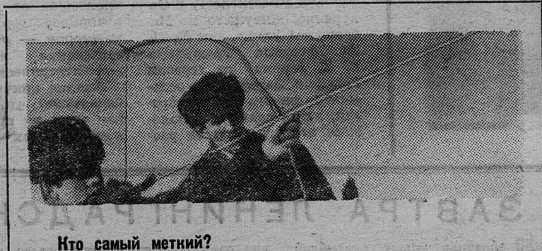
Кто самый меткий?