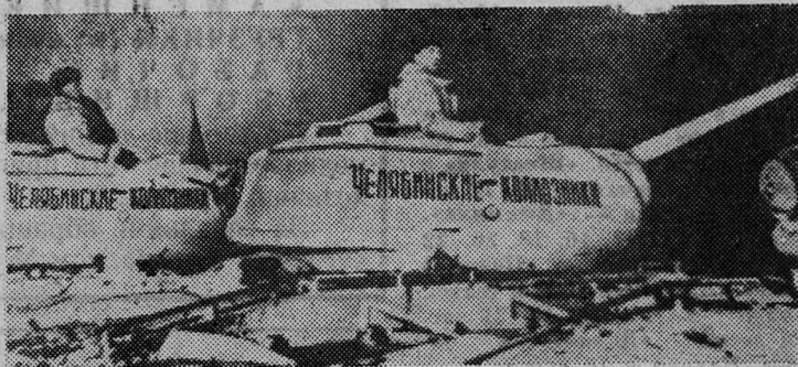
Танки, построенные на средства трудящихся Челябинской области. 1943 год.

Весной 1943 года с новой силой разгорелась борьба за господство в воздухе. Она началась в апреле большим воздушным сражением на Кубани и к середине лета охватила другие участки советско-германского фронта. Фашистская авиация несла невосполнимые потери.