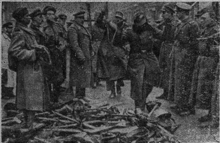
Гитлеровцы складывают оружие. Берлин. Май, 1945 год.