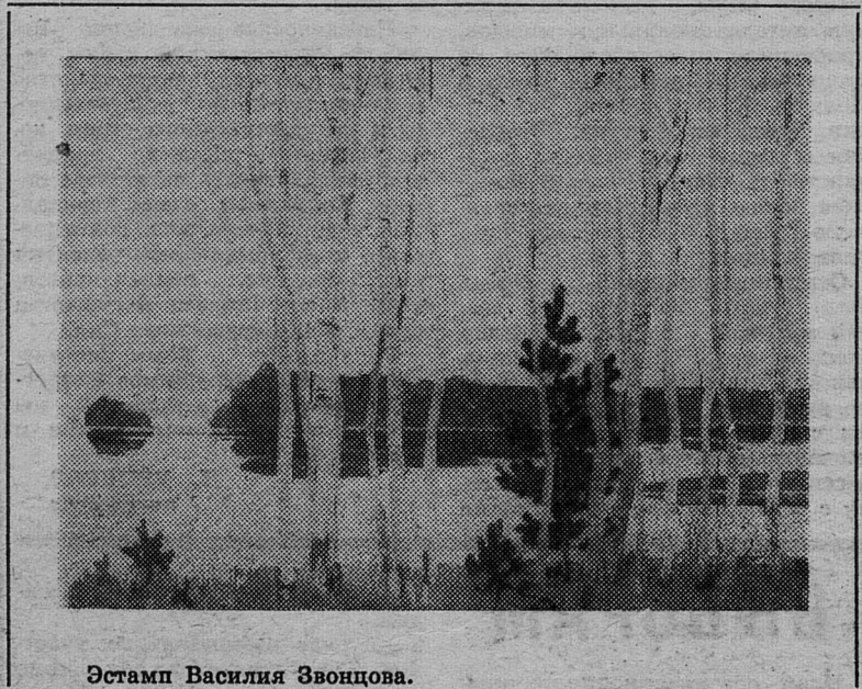
Эстамп Василия Звонцова.

Большой популярностью пользуется последние годы эстамп. О возросшем интересе к этому оригинальному виду изобразительного искусства свидетельствовала проведенная недавно в г. Сланцы выставка-продажа изобразительного искусства.