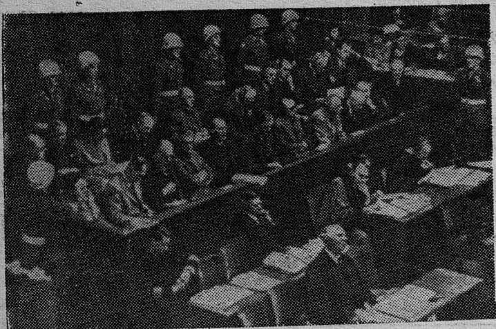
Нюрнбергский процесс. Военные преступники на скамье подсудимых.