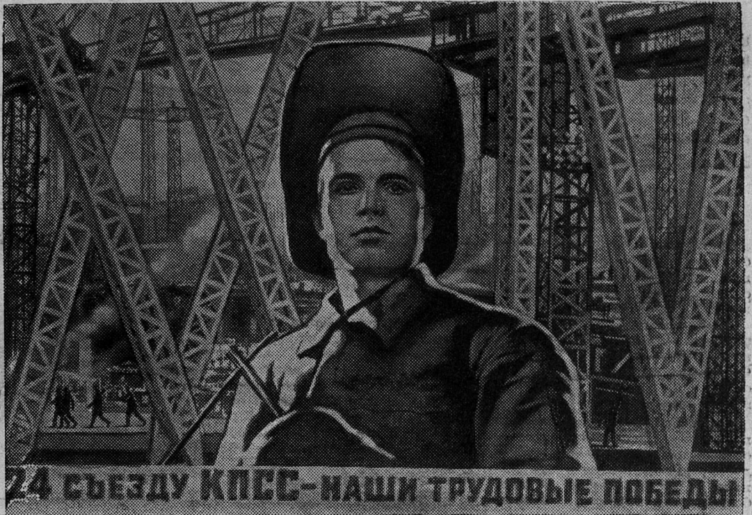
Плакат художника В. Корецкого (издательство «Изобразительное искусство»).