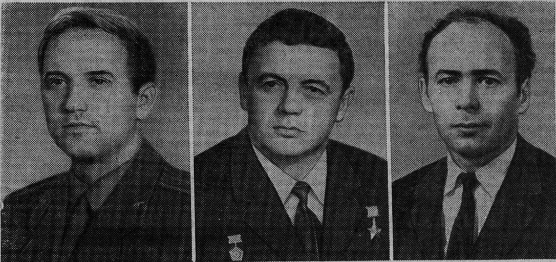
Экипаж космического корабля «Союз-11» (слева направо): командир корабля Г. Т. Добровольский, бортинженер В. Н. Волков и инженер-испытатель В. И. Пацаев.